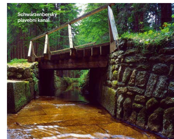
Schwarzenberský plavební kanál