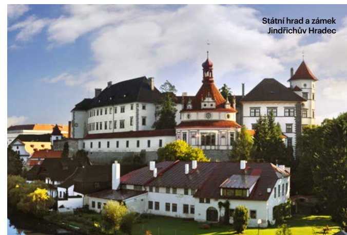
Státní hrad a zámek Jindřichův Hradec