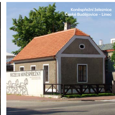
Koněspřežní železnice České Budějovice – Linec