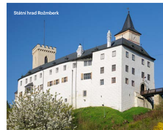
Státní hrad Rožmberk