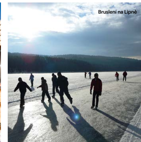
Bruslení na Lipně

Jeden z neznámějších zimních areálů na Šumavě nabízí na výběr 7 sjezdovek s celkovou délkou 4,5 kilometru, které se pravidelně upravují pro denní i večerní lyžování. Většina z nich se pravidelně zasněžuje a polovina z nich je osvětlena pro večerní lyžování. Ve středisku Kobyla, vzdáleném 6 kilometrů od obce Stachy na Vimpersku, mají sjezdovky lehký až