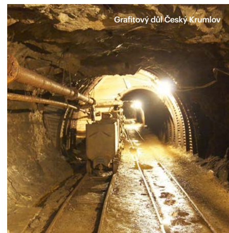
Grafitový důl Český Krumlov