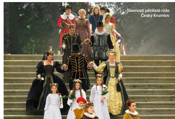
Slavnosti pětileté růže Český Krumlov