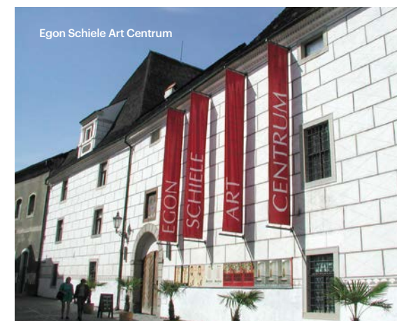
Egon Schiele Art Centrum